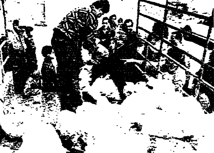
في رأس النبع